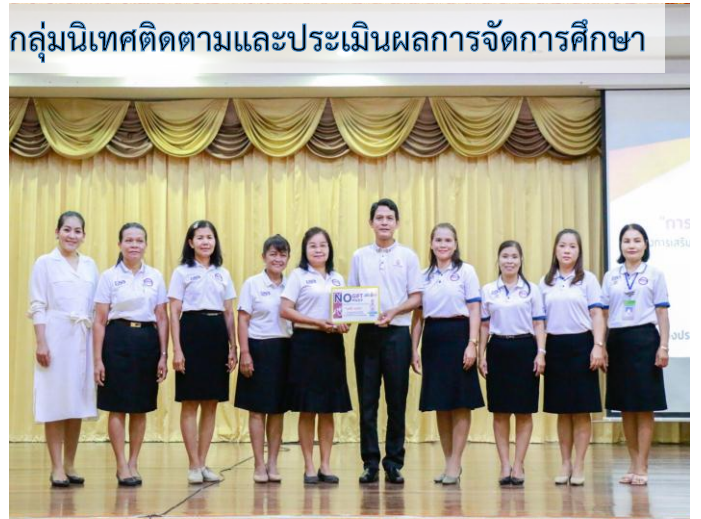
กลุ่มนิเทศติดตามและประเมินผลการจัดการศึกษา