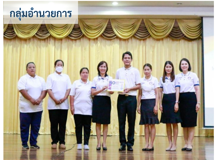
กลุ่มอำนวยการ