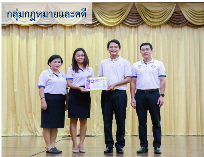
กลุ่มกฎหมายและคดี