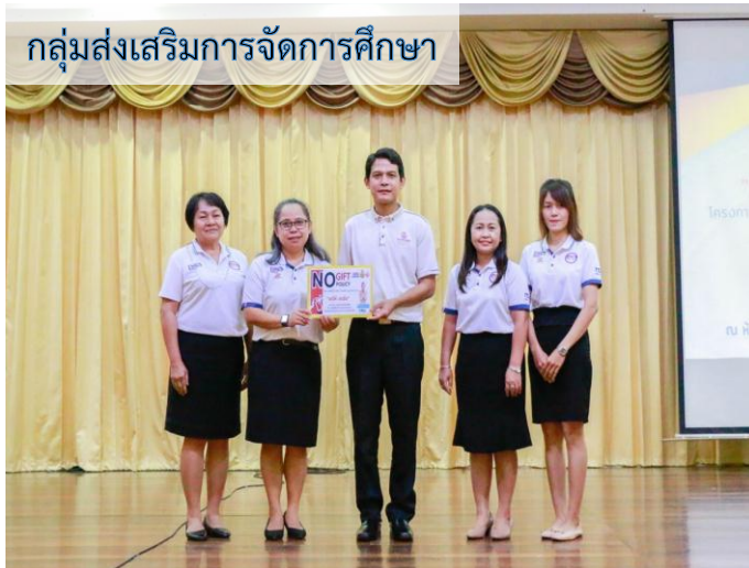
กลุ่มส่งเสริมการจัดการศึกษา