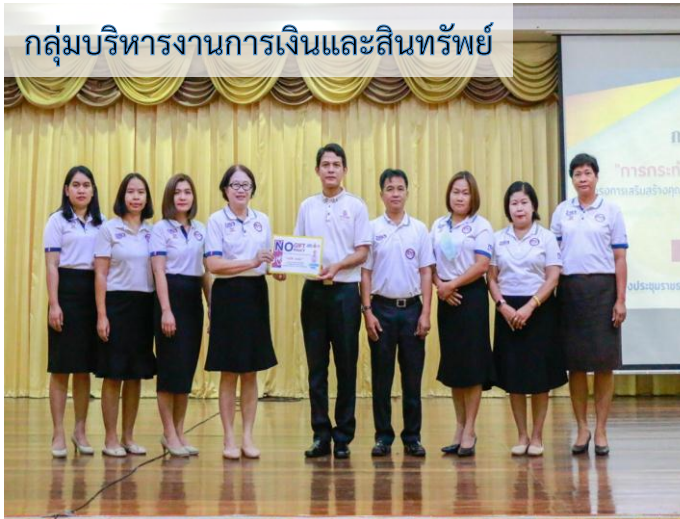
กลุ่มบริหารงานการเงินและสินทรัพย์