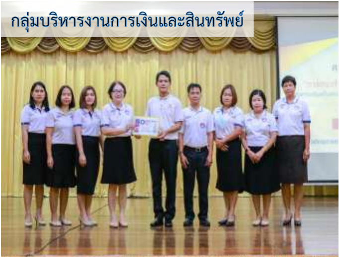
กลุ่มบริหารงานการเงินและสินทรัพย์