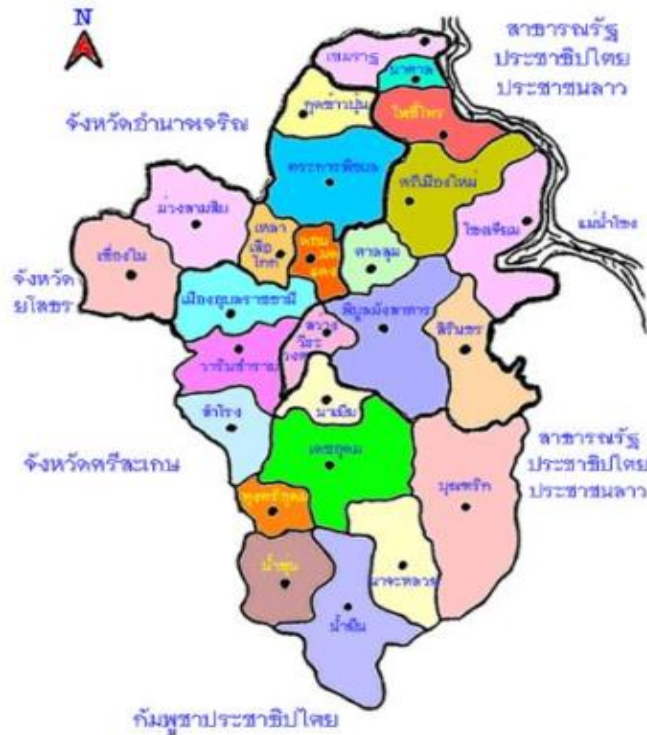
รูปภาพ ที่ 1.1 แสดงอาณาเขตติดต่อกับจังหวัดอื่นๆ