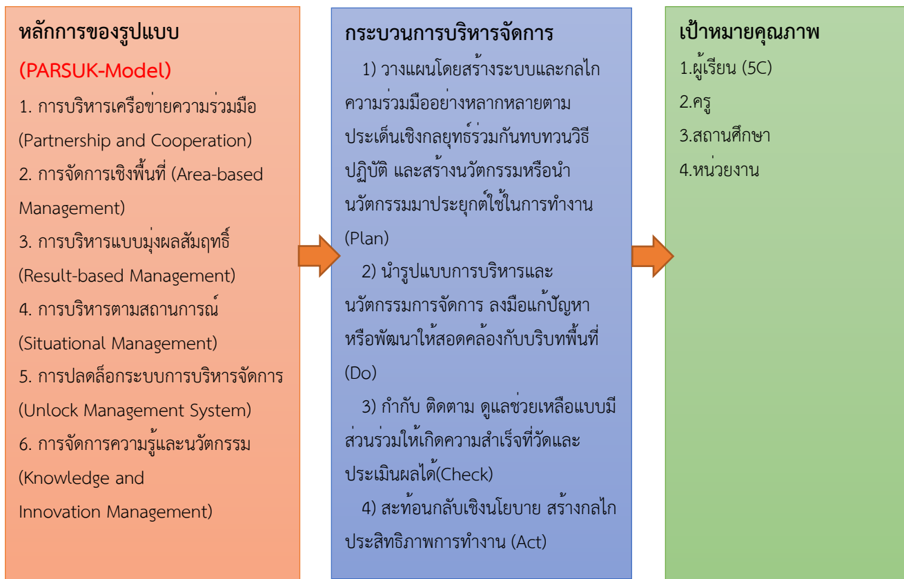
ภาพที่ 4.3 กระบวนการบริหารจัดการศึกษาขั้นพื้นฐาน ของสำนักงานเขตพื้นที่การศึกษา ประถมศึกษาอุบลราชธานี เขต 1

รูปแบบและกระบวนการบริหารจัดการศึกษาที่มุ่งผลลัพธ์ในการจัดการศึกษา ด้านการพัฒนาคุณภาพผู้เรียน ข้าราชการครูและบุคลากรทางการศึกษา สถานศึกษา และหน่วยงานทางการศึกษา ในพื้นที่รับผิดชอบให้มีการเปลี่ยนแปลงไปในทางที่ดีหรือมีการพัฒนามากขึ้น ซึ่งจะส่งผลต่อคุณภาพการศึกษา โดยขับเคลื่อนการดำเนินงานภายใต้หลักการและรูปแบบการบริหารจัดการศึกษาขั้นพื้นฐาน เพื่อให้บรรลุตามวัตถุประสงค์ที่วางไว้ร่วมกัน ได้ดังนี้