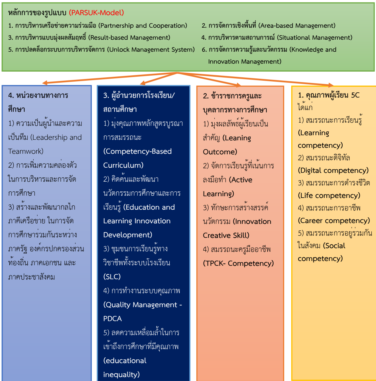
ภาพที่ 4.1 รูปแบบการบริหารจัดการศึกษาขั้นพื้นฐาน ของสำนักงานเขตพื้นที่การศึกษาประถมศึกษาอุบลราชธานี เขต 1