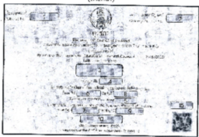
(ด้านหลัง)